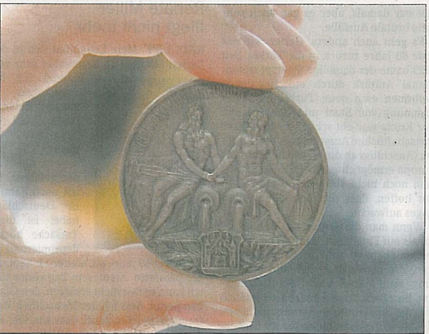
Zur feierlichen Eröffnung des Aschaffener Mainhafens im Jahr 1921

i Öffnungszeiten sind Montag bis Freitag von 9 bis 16 Uhr. Der Eintritt ist frei.